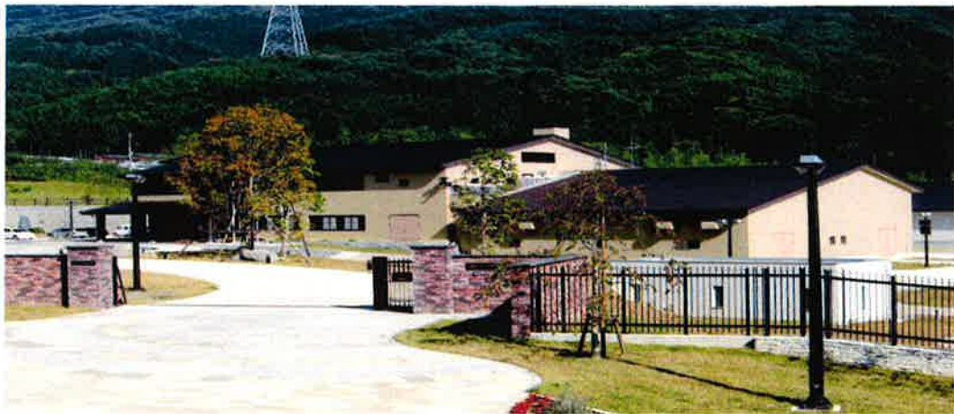
柚 口 浄 水 場