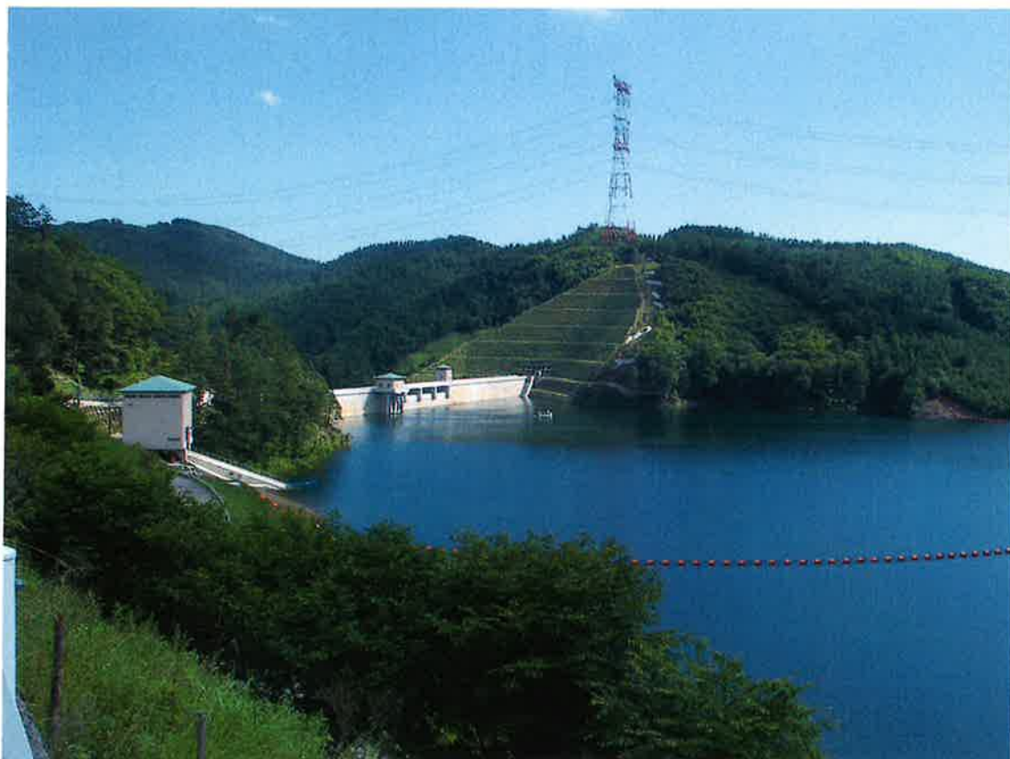
琴 川 ダ ム

柚口浄水場は、水源を琴川ダムからの放流水に依存しているため、ダム水の将来的な富栄養化による植物性プランクトンの発生やダム水放流後の流域河川等からの流入水の影響が懸念されることから、特に異臭味に関する項目については継続的な監視を実施します。