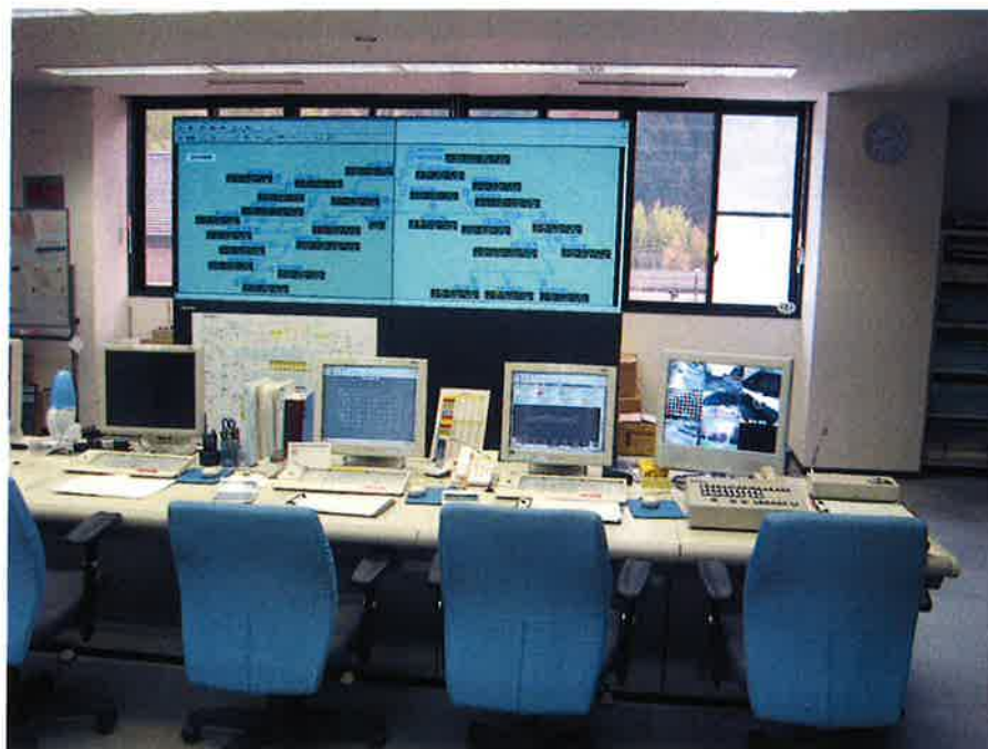
杣口浄水場中央監視室