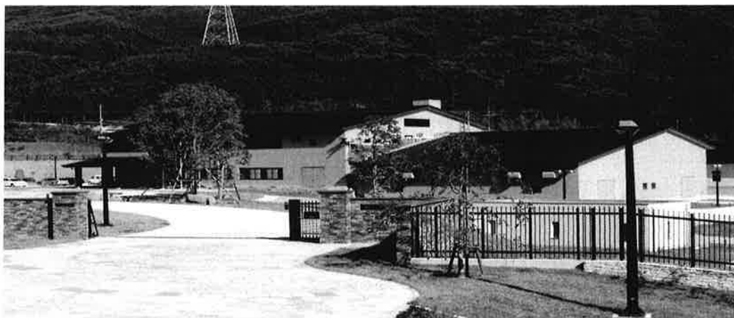
柚 口 浄 水 場